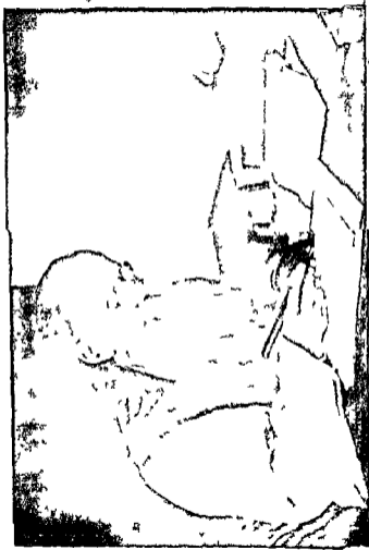
मानवधर्मव्याख्याता आचार्ये श्रीमन्नान्दास. एम० ए०. डी० लि०